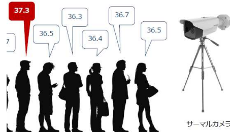
HIKVISION製サーマルカメラ