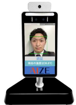
AIZE Biz +サーモ