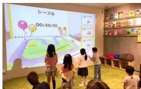
イベント会場の入口