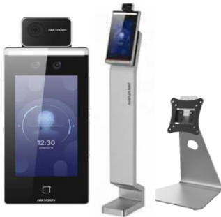
HIKVISION製小型 温度測定端末